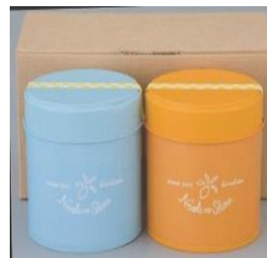
瀬戸内ネロリの島(大崎上島・下島)オリジナルティーの詰合せ