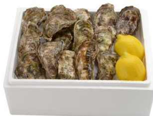
殻つきかき&瀬戸内ひろしまレモンセット

既存の「瀬戸内ひろしまレモン特集」「ひろしまの酒特集」に加え、 秋から冬にかけては新たに生かき、かき加工食品を豊富に取り扱う「広島かき特集」を実施（9月予定） 広島かきの認知度向上と、かきの味を1年間通して味わえる新しい価値観の提案で、 ひろしま県産品の魅力を 全国 へ紹介