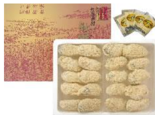
広島県宮島産 冷凍カキフライ大粒20粒