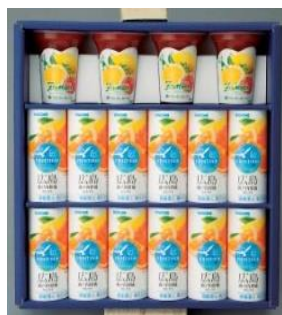
瀬戸内ひろしま柑橘ジュース&フルーツマ詰合せ