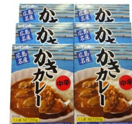
かきカレーセット