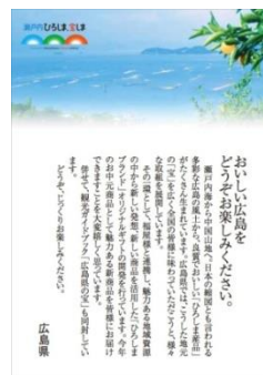
メッセージカード