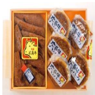
広島牛の網焼き・ハンバーグ詰合せ